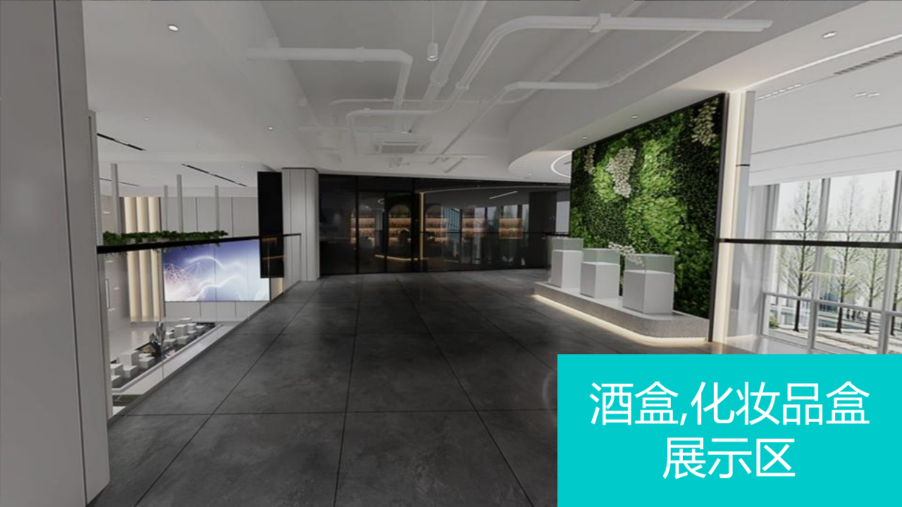
酒盒,化妆品盒 展示区